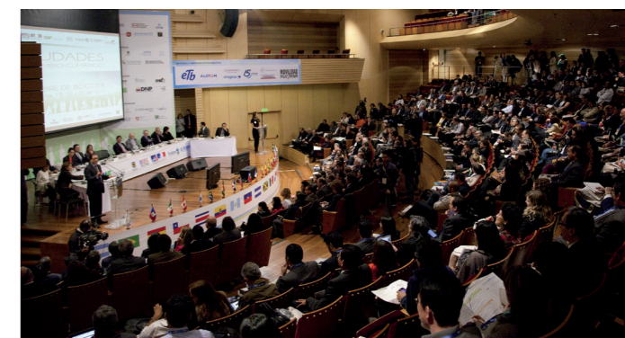
Ceremonia de apertura de la cumbre de Bogotá

región han expresado en múltiples escenarios y reiterado en la Cumbre de Bogotá y en esta publicación, su voluntad de trabajar conjunta y decididamente para afrontar los retos derivados del cambio climático. En este sentido, en el marco de la Cumbre “Ciudades y Cambio Climático”, 17 urbes se unieron al Pacto de ciudad de México contra el Cambio climático y más 25 ciudades hispanoamericanas firmaron la Declaración de Bogotá “Ciudades Humanas frente al Cambio Climático”, la cual subrayó el enfoque de adaptación al cambio climático propuesto por el foro de Alcaldes de Bonn. ■