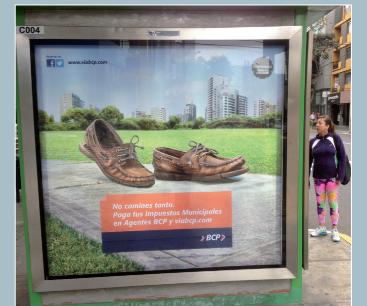
Perú: innovación en marcha o cómo pagar sus impuestos locales en las sucursales bancarias

su potencial turístico y a los retos que la caracterizan en términos de contaminación, seguridad y abandono. El «Programa Estratégico de Desarrollo Integral para las familias del Borde Costero de Pisco» (conocido como «Yo soy Pisco») se desarrolló en 2011, con el apoyo de la alcaldía y del sector privado, con el objetivo de proporcionar al Gobierno local con una cartera de proyectos, y un programa de gestión social para las familias de la zona. El programa busca transformar toda la zona, creando espacios públicos que promuevan la