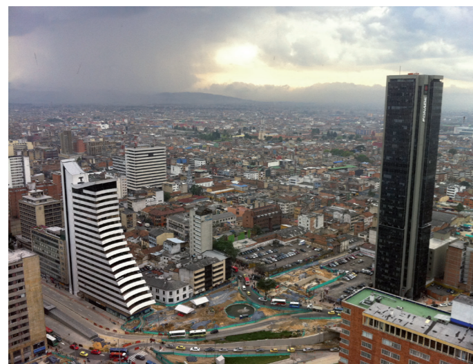
Vista de la ciudad de Bogotá

Banco de desarrollo, la Agencia también quiere asumir un rol de iniciador de intercambios de prácticas y reflexiones en torno al desarrollo urbano sostenible. Es así como financia dispositivos de cooperación técnica que acompañan los préstamos bancarios y genera una lógica de intercambio muy apreciada por sus socios. Es así como en México, el financiamiento AFD apoya una cooperación técnica sobre la temática de la densificación urbana iniciada por la ANRU (Agencia Nacional para la Renovación Urbana) y la ANAH (Agencia Nacional del Hábitat). En Río de Janeiro, el sindicato de transportes de Ile de France (STIF) asociado con el Instituto de ordenamiento y urbanismo de Ile de France junto con la oficina de estudios SYSTRA, empezó intercambios con el estado de Río y las autoridades metropolitanas de la ciudad. En cuanto a la ciudad de Medellín, se beneficia con la experiencia del (APUR) Taller del urbanismo de París, para apoyar el proyecto de planeación a largo plazo “Medellín