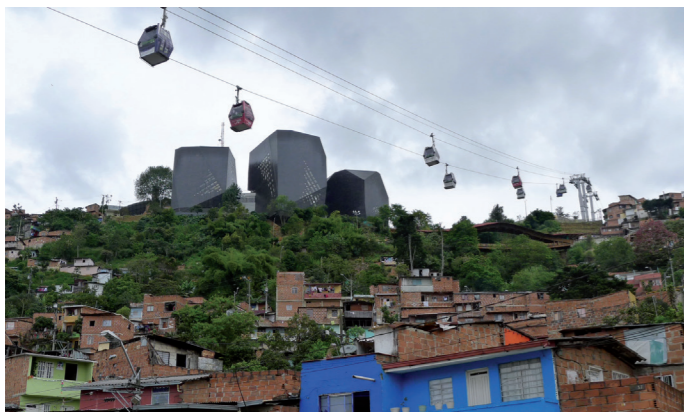
El metro cable y la biblioteca de España del barrio Santo Domingo de Medellín (Colombia)

El primer modelo de intervención en el año 2004, se apoya en la implementación del sistema de transporte por cable (Metrocable) y sus nuevas estaciones como la base esencial en la definición de la estrategia territorial. El PUI Nor Oriental, potenció la ubicación de las estaciones, con el objetivo de complementar y ampliar el impacto generado por el Metrocable. Se implementó un proceso de consolidación barrial que permitiera estructurar y ordenar el territorio (y no solamente mejorar su accesibilidad) a través de obras