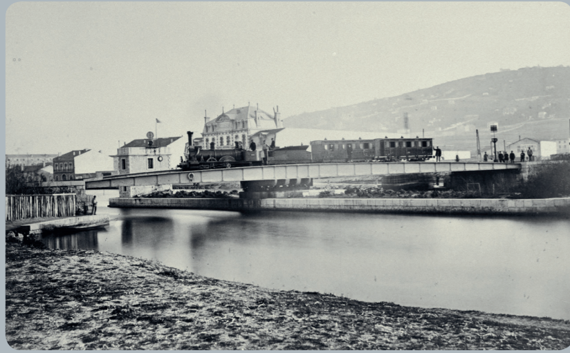
Pont tournant de Cette [Compagnie du Midi]. Ministère des travaux publics, vues photographiques Aude, Hérault, Gard, Vaucluse, Ardèche